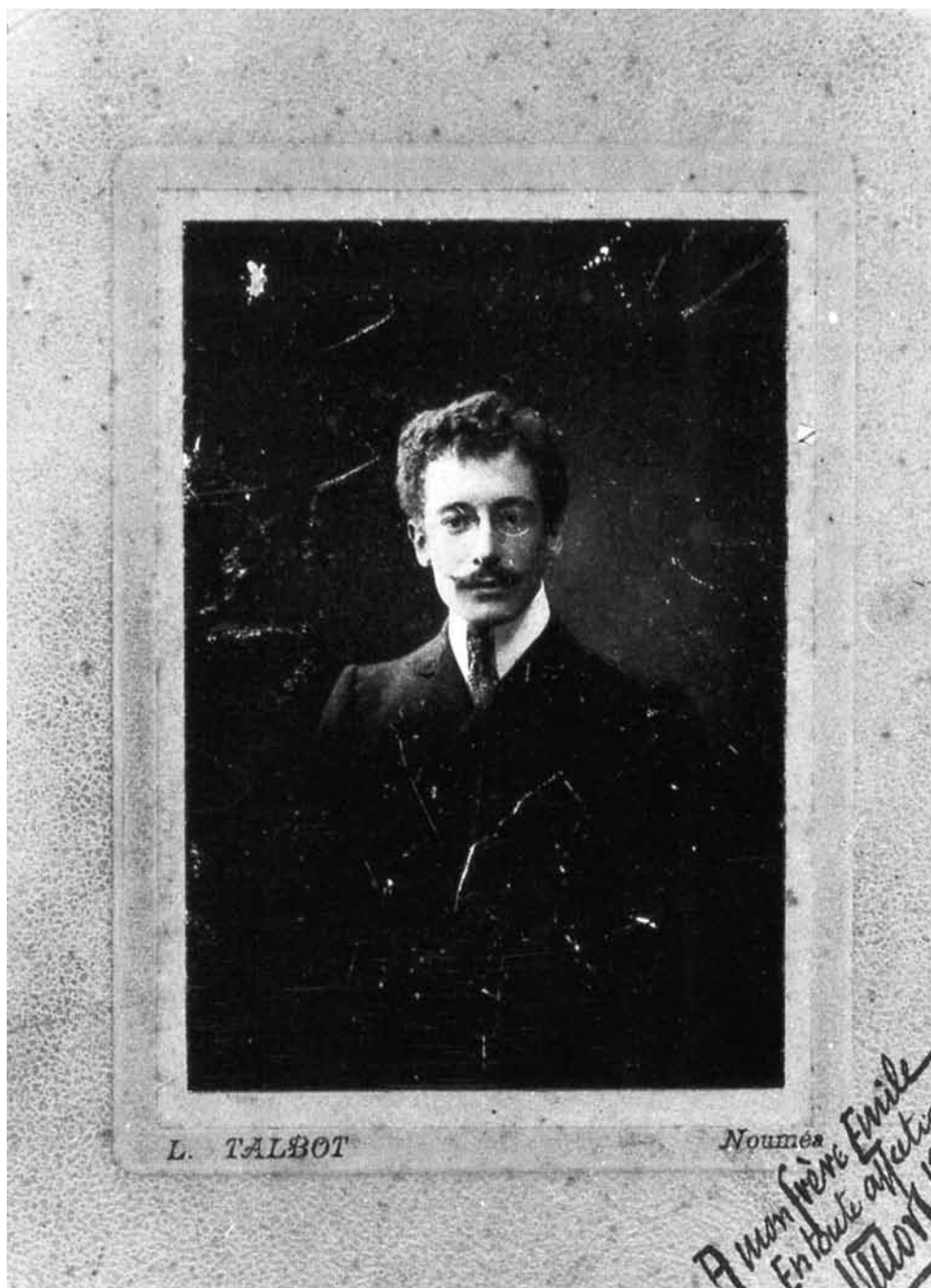
Figure 7 Victor Segalen par Louis Talbot, 1903 ou 1904. Epreuve au gélatino-bromure d'argent sur papier albuminé, contrecollée sur carton. Exemplaire dédié à Emile Mignard, destinataire de nombreuses lettres de la Correspondance .