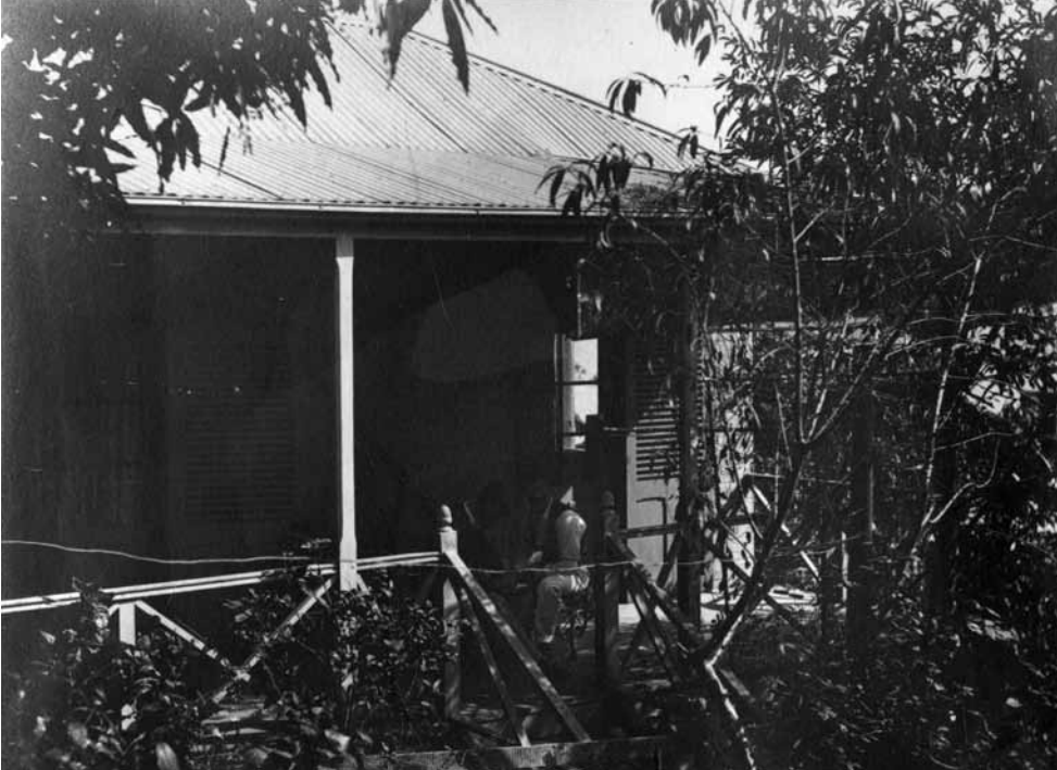
Figure 1 Mon Home à Nouméa en 1902 . Photographie albuminée de l'album Nielly, Service des Archives de la Nouvelle-Calédonie, n° 148 Fi5-037.

ornementaux ( Alocasia macrorrhiza ), lauriers-roses ( Nerium oleander ), niaoulis rouges pleureurs ( Callistemon viminalis ), ainsi qu'un arbre fruitier aujourd'hui assez rare au premier plan à gauche, le néflier du Japon ( Eriobotryca japonica ).