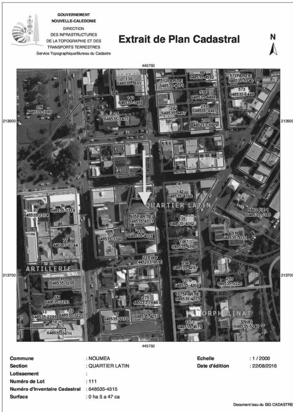
Figure 3 Plan cadastral contemporain du Quartier Latin, Nouméa. La flèche jaune indique le lot 803, légué par Arthur Pelletier à ses petits-enfants.