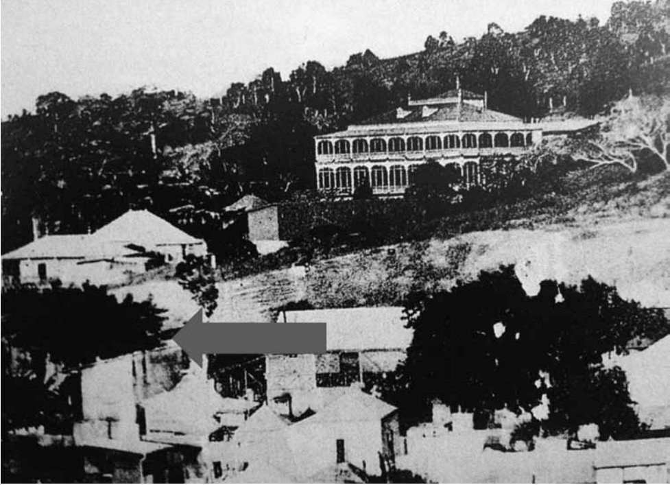
Figure 4 Le Chrome Manoir au début du 20 ème siècle (détail d'une carte postale éditée par D. Gubbay, collection particulière, Nouméa). La flèche indique le lot 803.

C'est donc en légère périphérie du centre-ville que Victor Segalen s'installe, lors de son second séjour nouméen. On comprend les mentions de bicyclette, 32 qu'il utilise pour aller à l'hôpital militaire et rendre visite à ses patients, d'autant plus que les frères Nielly, qui ont le même âge, pratiquent ce sport assidûment: Patrice Nielly s'illustre à plusieurs reprises dans des courses cyclistes locales dans les années 1900–1903. 33 La maison d'origine n'existe plus aujourd'hui, même si les piliers en brique que surmontait la grille en fonte séparant le terrain de la rue de Sébastopol se dressent toujours, devant un parking vide (fig. 5).